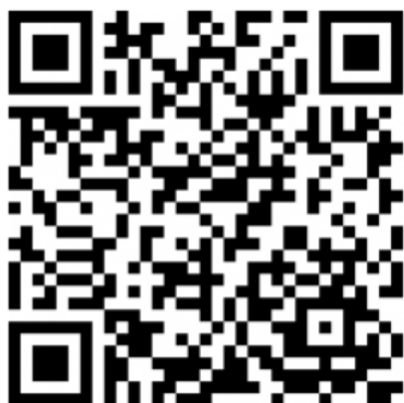
Código QR para descargar LinkTo Sport