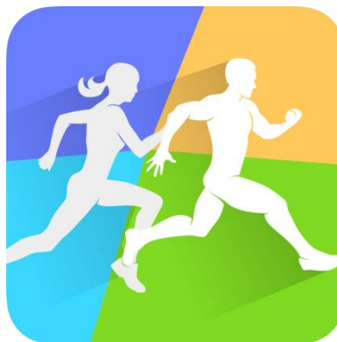
Icono de la aplicación LinkTo Sport